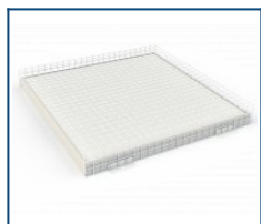
Защитная решетка для Dioga Office